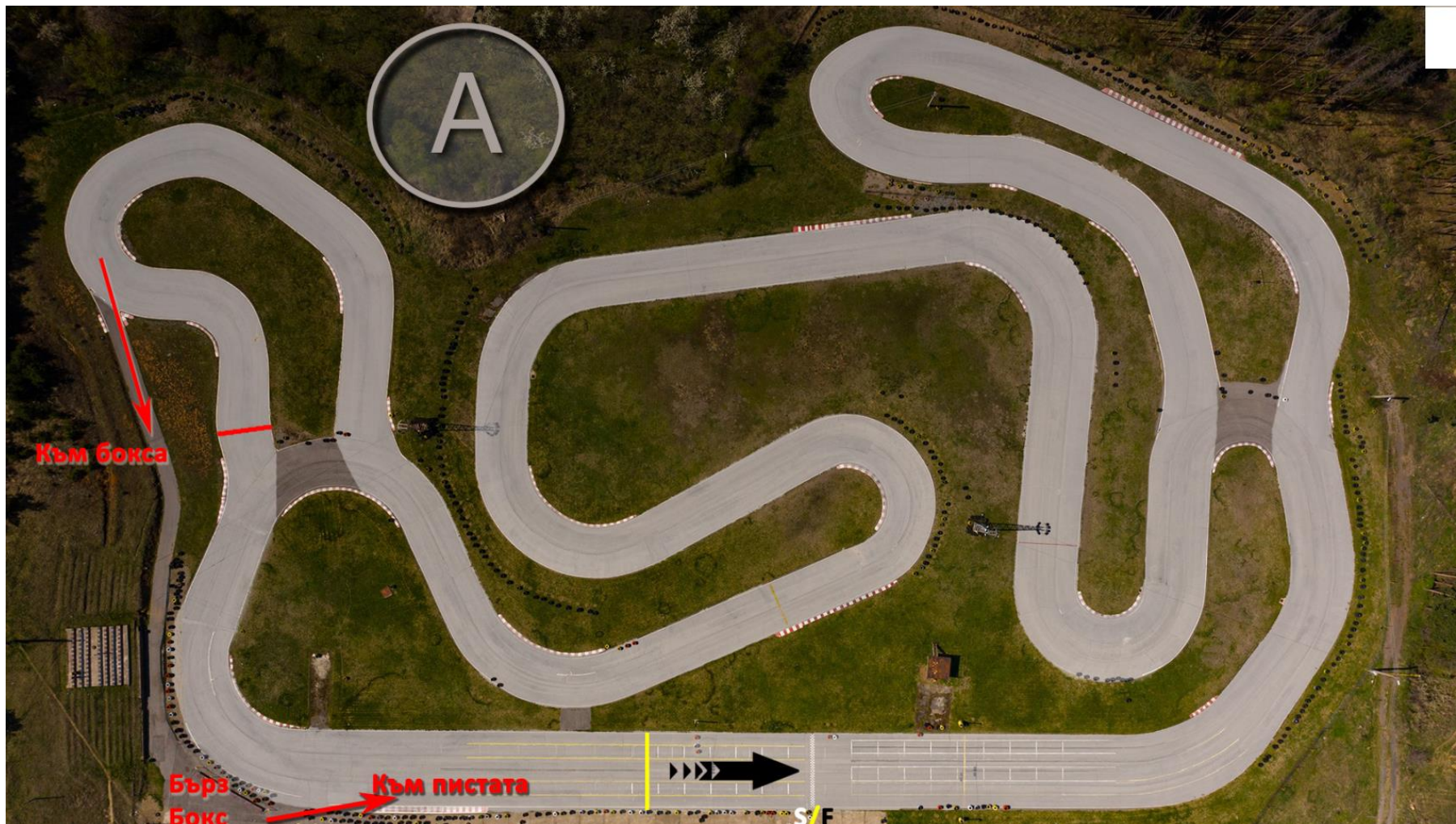
СХЕМА НА ТРАСЕТО